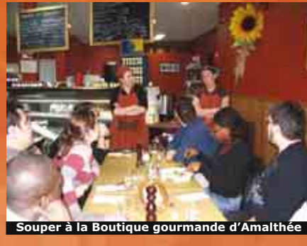
Souper à la Boutique gourmande d'Amalthée